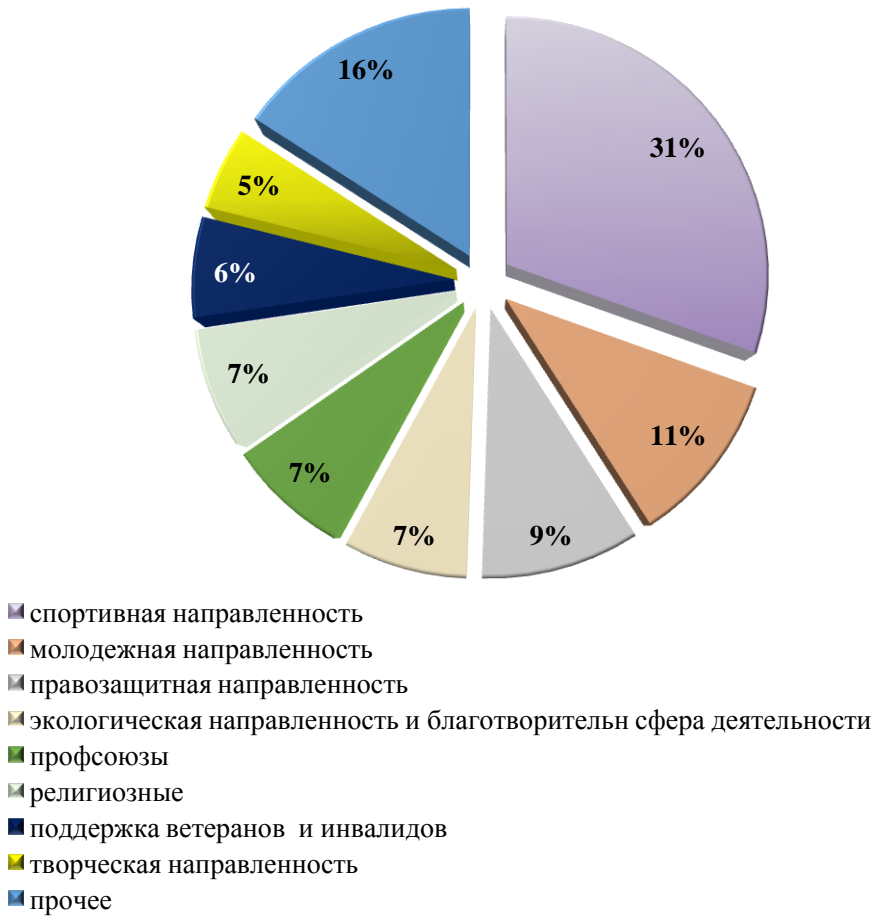
Сферы деятельности СО НКО

В 2015 году на базе МБУ «Библиотека» создан и успешно продолжает действовать Ресурсный центр, который осуществляет организационное, информационное и консультационное содействие СО НКО в разработке и реализации социальных программ, проектов и инициатив. В целях решения социально значимых общественных проблем г. Зеленогорска в 2018 году Ресурсным центром: